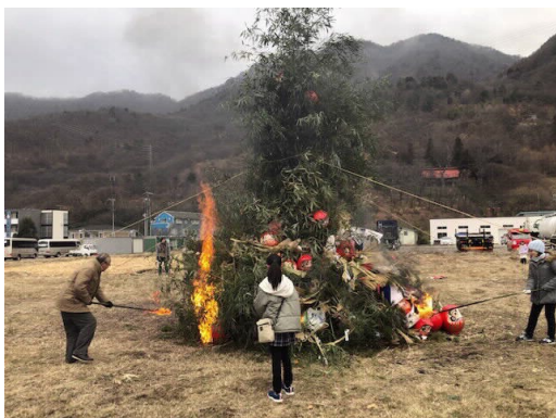
どんど焼き点火式